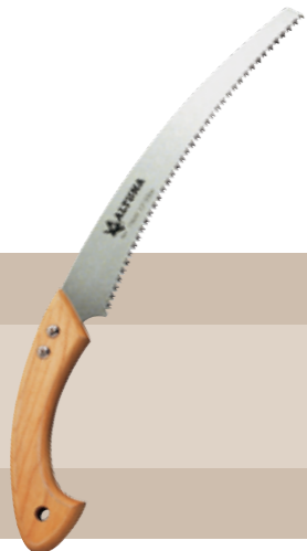
14'70 euros SERRUCHO DEN JAPÓN 33 CM Serrucho poda profesional 330 mm ALTUNA. Corte curvo. "Dentado japonés". Para madera verde y seca. Interior de empuñadura de aluminio.