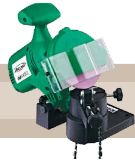
34'95 euros AFILADOR DE CADENAS UNIVERSAL Afilador de cadenas universal. Potencia de motor: 220 W. 7.500 r.p.m. Muela: 100 mm.