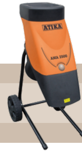
174'95 euros BIOTRITURADORA AMA2500 2,5 kW, 230 V, 50 Hz. Motor eléctrico con freno, interruptor de seguridad y protección de pre-arranque, Tritura arbustos y ramas. 2 tiempos de marcha atrás y cuchillas especiales de acero endurecido, Máximo de ramas aprox. Ø4 cm.