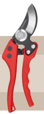
10'95 euros TIJERA 1 MANO NYLON HANDLES CORONA Tijera ergonómica con mangos de nylon reforzados. Capacidad de corte 19mm.