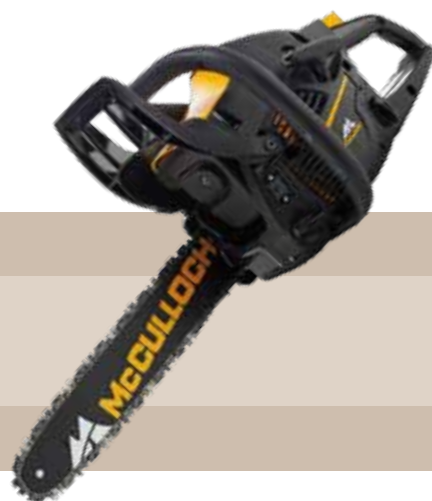
179'90 euros MOTOSIERRA GASOLINA CS340 Potencia del motor: 1,26 kW. Cilindrada: 34 cc. Longitud espadín: 14"/ 35 cm, Paso de cadena: 3/8" Peso: 5,2 kg. Porta-herramienta integrado. Tensor de cadena lateral.