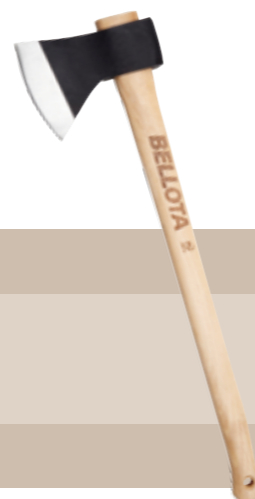
16'95 euros HACHA VIZCAÍNA Hacha forjada de acero especial. Temple preciso y equilibrado en la zona del filo que permiten un mejor corte.