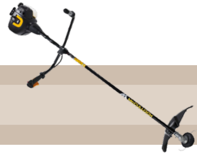
279'90 euros DESBRUZADORA GASOLINA B288 Potencia del motor: 0,8 kW. Cilindrada: 28 cc. Peso: 5,2 kg. Manillar doble. Motor limpio con rendimiento óptimo, incluso a pocas o medianas revoluciones. Catalizador: menos emisiones y menos ruido. Cigüeñal en 3 partes y embrague centrifugo: más flexible y resistente. Arranque fácil y sin esfuerzo: vuelta automática del botón Stop, bomba de arranque y sistema Softstart (-40% de esfuerzo para el arranque). Sistema de salida del hilo Tap N' Go. Accesorios: un cabezal de hilo, un disco de corte y un arnés.