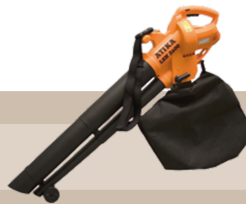
65'95 euros ASPIRADORA/SOPLADOR LSH2600 Velocidad variable para diferentes usos: hojas y basura. Reducción del volumen de residuos por trituración. Incl. bolsa de recogida (45 l). Motor eléctrico 2,6 kW, 230 V, 50 Hz, Velocidad soplado 270 km/h. Caudal 720m³/h.