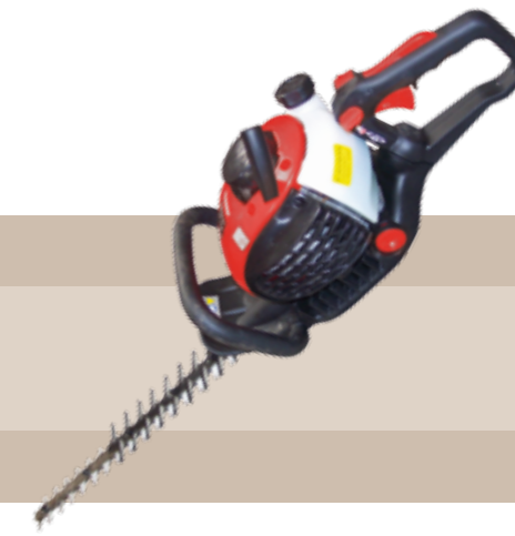
174'95 euros CORTASETOS GASOLINA 24,5 CC Cortasetos de gasolina Camon, ligero potente y sólido, equipado con un motor de 2 tiempos de 25 cc y unas cuchillas de doble corte y de alta resistencia al desgaste unidas a una caja de engranajes de alta calidad y su asa trasera giratoria 180°.