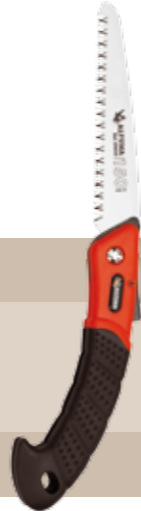
13'86 euros SERRUCHO HOJA PLEGABLE 7"/180 MM REF. 29623 Serrucho plegable poda profesional 180 mm ALTUNA. "Dentado japonés". Para madera verde y seca. Interior de empuñadura de aluminio.