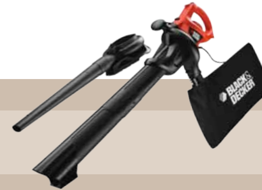
84'95 euros SOPLADOR ELÉCTRICO GW2200 Aspirador soplador de alto rendimiento, ligero y cómodo, que proporciona potencia y rendimiento para limpiar rápidamente el jardín. Hasta 260 km/h. de velocidad de soplado y bolsa recogedora de 35 litros de capacidad. Fácil cambio de aspirador a soplador y acción trituradora.