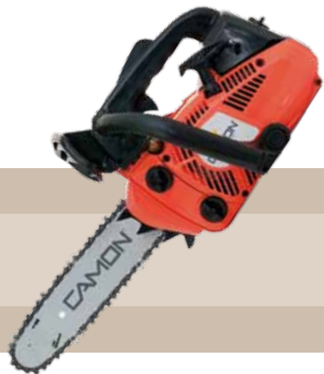
164'95 euros MOTOSIERRA GASOLINA TCS 2600 Motosierra poda semi-profesional motor gasolina 2 tiempos, cilindrada: 25,4 cc. Potencia: 1,5 Hp. Peso: 2,9 kg. Longitud de barra: 10"/ 25 cm. Tipo de cadena: 3/8 BP. Bomba de engrase automática y regulable.