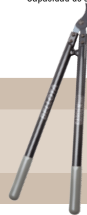
34'50 euros TIJERA 2 MANOS JARDÍN Para poda de ramas verdes y gruesas. Contrahoja dentada. Mangos de poliamida reforzada.