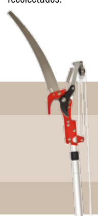
35'15 euros PÉRTIGA CORTARRAMAS CON SERRUCHO EXTENSIBLE MÁX. 2,50 M Tijera cortarramas de jardín con serrucho. Extensible 1,30 - 2,50 m. Mecanismo multiplicador de triple acción