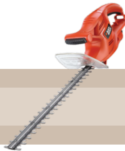
49'95 euros CORTASETOS ELÉCTRICO GT 4245 Cortasetos 420 W. 45 cm de longitud de la espada y 16 mm de espacio entre dientes, es adecuado para pequeñas coberturas. Diseñado para que sea cómodo y seguro de manejar. Sistema simple de cable y retención del cable para un manejo seguro.