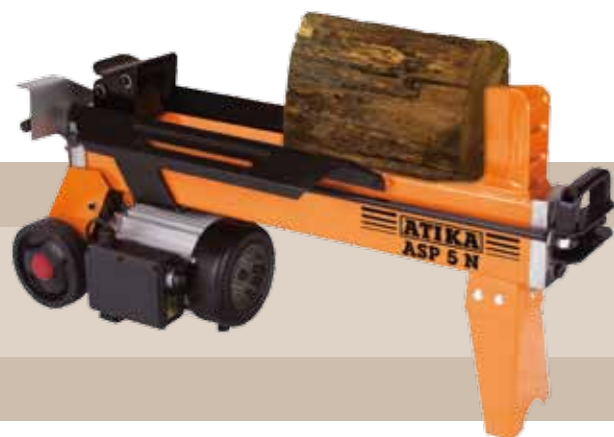
314'95 euros ASTILLADORA DE LEÑA ASP5N Fuerza de impacto 50 kN (5t), longitud máxima 520 mm, diámetro máximo 50 - 250 mm, carrera máximo 420 mm. Motor eléctrico 1,5 Kw, 230 V, 50 Hz.