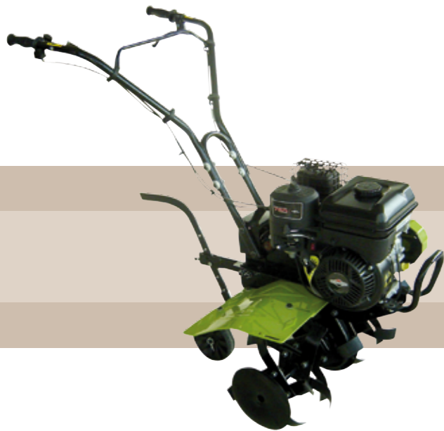
499'00 euros MOTOAZADA GASOLINA 6,5 HP Motoazada gasolina 68 cm ancho de labor, cuchillas atornilladas, motor 4T 196 CC OHV, transmisión de correa a cadena.