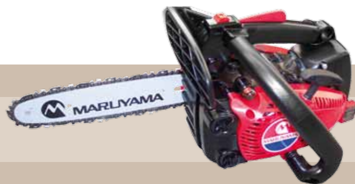
395'00 euros MOTOSIERRA MARUYAMA PROFESIONAL PODA 30 CC - 35 CM Motor gasolina 2 tiempos, cilindrada: 30cc, peso: 3,1 kg, longitud de la barra: 14"/ 35 cm, capacidad depósito gasolina: 240 ml.