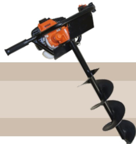
319'95 euros AHOJADORA DE TIERRA ELB52 Incluye 3 taladros, longitud aprox. 1.070 mm, longitud de taladro 800 mm, con bomba de cebado y palanca del estrangulador para un mejor arranque, depósito de combustible 1,2 l. Motor de gasolina de 2 tiempos 2,2 kW, 51,7 cm³.