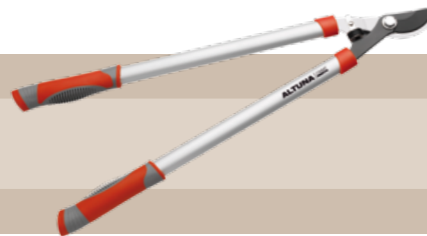
15'52 euros TIJERA DE PODA 2 MANOS ALUMINIO Tijera de poda 2 manos hoja teflonada (70 cm.) Mangos de aluminio ovalado. Empuñadura ergonómica.