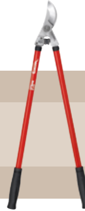
14'50 euros TIJERA 2 MANOS BYPASS CORONA Tijera con mangos de acero tubulares. Capacidad de corte 38 mm.