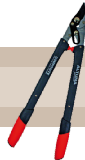
21'33 euros TIJERA DE 2 MANOS CON ARTICULACIÓN Tijera de 2 manos con articulación J482. Hoja teflonada con sistema de desmultiplicación para facilitar el esfuerzo en el corte. Topes de goma cambiables. Mangos de composite: Fibra de Vidrio + Nylon. Empuñaduras de bimaternal ergonómicos y antideslizantes. Longitud Total: 60 cm.