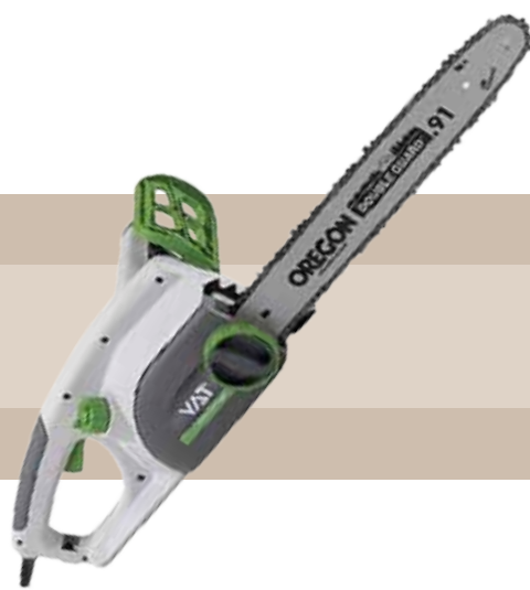
99'00 euros MOTOSIERRA ELÉCTRICA 1.800 W Motor transversal, capacidad depósito aceite 100 ml., longitud de barra 16"- 40 cm.