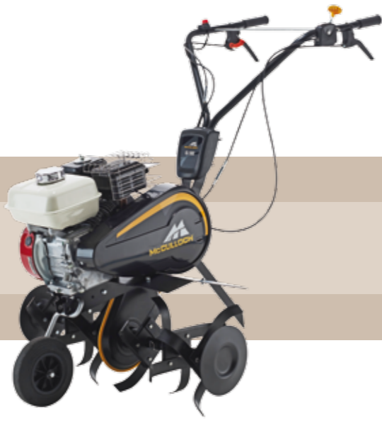
695'00 euros MOTOAZADA MCCULLOCH MFT85-700R Motor horizontal OHV Briggs & Stratton 750 series, 163 cc, 3,3 kW a 3.300 r.p.m., 6 fresas Ø de fresa: 33 cm. Ancho de trabajo: 84 cm. Profundo de trabajo: 28 cm. 1 marcha adelante + 1 marcha atrás. Superficie recomendada: 1.000 m².