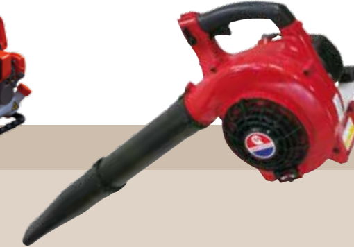
389'00 euros SOPLADOR PROFESIONAL MANO Motor gasolina 2 tiempos, cilindrada: 30,1 cc. Peso 4,3 kg. Volumen 13 m³/min. Velocidad 72,1 m/seg.