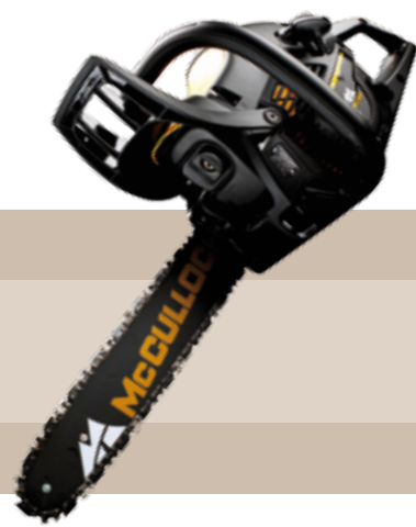
229'90 euros MOTOSIERRA GASOLINA CS380 T Potencia del motor: 1,4 kW. Cilindrada: 38 cc. Longitud espadín: 16"/ 40cm, Paso de cadena 3/8". Peso: 5,2 kg. Porta-herramienta integrado. Tensor de cadena rápido y sin herramienta.