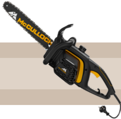
149'90 euros MOTOSIERRA ELÉCTRICA CSE 1835