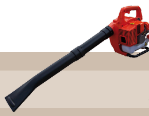
189'00 euros SOPLADOR SEMI PROFESIONAL MANO Motor gasolina 2 tiempos. Cilindrada: 25 cc., peso: 4,6 kg, volumen max. aire: 7,8 m³/min. Velocidad max: 72,1 m/seg.