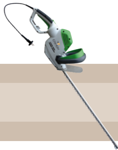
84'75 euros CORTASETOS ELÉCTRICO 710 W Cortasetos eléctrico Camon equipado con motor de 710 W de fácil manejo por su bajo peso (3,8 kg) con una barra de corte de 60 cm y su asa trasera giratoria de 180° lo convierten en la máquina indispensable para los setos más difíciles de cortar.