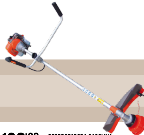
198'00 euros DESBRUZADORA GASOLINA Los desbrozadores de Gasolina Camon CG330E y CG430E figuran entre las más ligeras del mercado, están equipadas con una robusta transmisión, cabezal de nylon y disco de tres puntas, sistema de manillar doble. Desbrozadores perfectos para cualquier condición y circunstancia de trabajo.