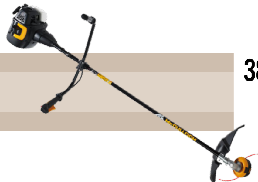
389'90 euros DESBRUZADORA GASOLINA B40 Desbrozadora semi-profesional McCULLOCHB40 B ELITE. Potencia del motor: 1,5 kW. Cilindrada: 40 cc. Peso: 7,9 kg- Manillar doble. Moteur OxyPower® :-20% de consumo de gasolina, -75% de emisiones contaminantes. Motor limpio con rendimiento óptimo, incluso a pocas o medianas revoluciones. Cigüeñal en 3 partes y embrague centrifugo: más flexible y resistente. Arranque fácil y sin esfuerzo, vuelta automática del botón Stop, bomba de arranque y sistema Softstart (-40% de esfuerzo para el arranque). Sistema de salida del hilo Tap N' Go. Accesorios: un cabezal de hilo, un disco de corte y un arnés doble.