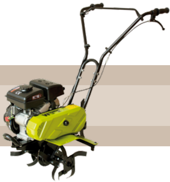
349'00 euros MOTOAZADA GASOLINA 98 CC Motoazada gasolina, 40 cm ancho de labor, cuchillas atornilladas, motor 4T 98 cc OHV, transmisión de correa a cadena.