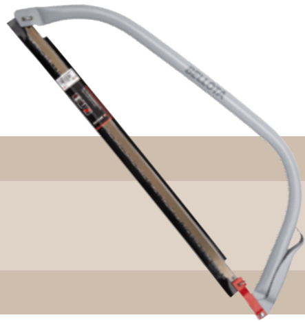
6'50 euros ARCO DE SIERRA Sistema de anclaje especial Bellota mediante anilla de enganche. Arco profesional con protector de la mano para mayor seguridad.