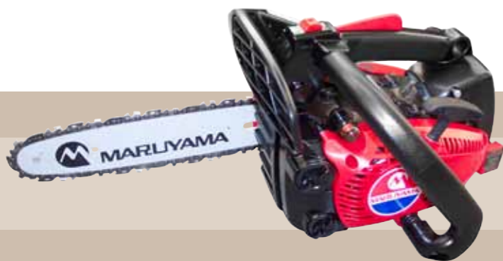
334'90 euros MOTOSIERRA MARUYAMA PROFESIONAL PODA 30 CC - 25 CM Motor gasolina 2 tiempos, cilindrada: 30 cc, peso: 2,8 kg, longitud de la barra: 10"/25 cm, capacidad depósito gasolina: 240 ml.