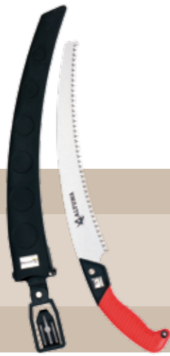
16'70 euros SERRUCHO CURVO 330 MM CON FUNDA 29604 Serrucho poda profesional 330 mm ALTUNA. "Dentado japonés". Para madera verde y seca. Funda profesional rígida para acople a cinturón. Interior de empuñadura de aluminio.