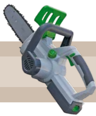
139'95 euros MOTOSIERRA BATERÍA LITIO 18 V 1,3 Ah, autonomía 10-15 min. con troncos de 10 cm, tiempo de recarga 60 min., longitud de barra 20 cm, peso con batería incluida 2,4 kg.