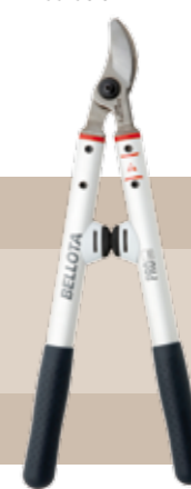
42'95 euros TIJERA LIGERA VIÑA Tijera ligera para poda de viña. Especialmente diseñada para la poda de viña y punteo.