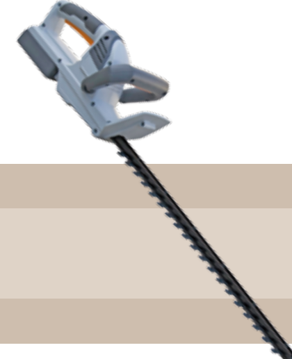
125'95 euros CORTASETOS BATERÍA LITIO 18 V El cortasetos de Camon con batería de Litio es la máquina ideal para el cuidado de su seto sin cables ni ruidos, su doble cuchilla de 45 cm y la autonomía de su batería (20 min) le permitirán cuidar su seto de forma fácil y rápida.