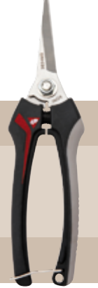
6'50 euros TIJERA INOX PARA RECOLECCIÓN Inox: protección contra la oxidación, evita el contagio de plagas. Geometría de la hoja que evita dañar los racimos recolectados.