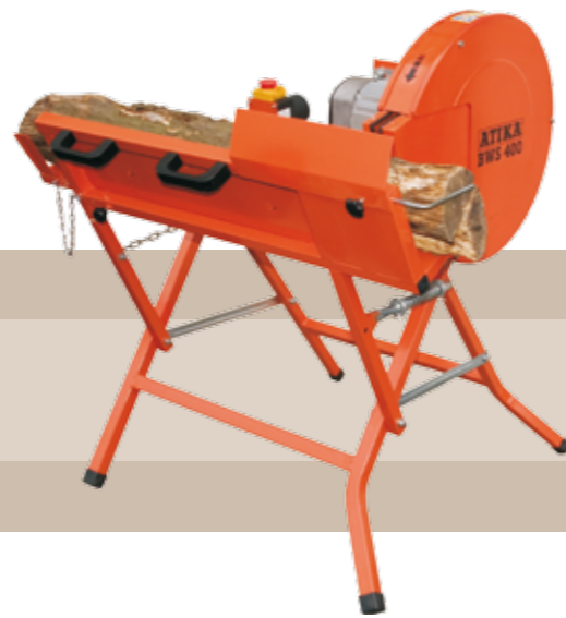
374'95 euros SIERRA CIRCULAR BWS400 Corta grandes piezas de madera, banco longitudinal, extensión de la placa de soporte de hasta aprox. 300 mm, muelle de recuperación, profundidad de corte de hasta aprox. 120 mm. Sierra de Ø400 mm. Motor eléctrico 1,8 kW, 230 V, 50 Hz con autostop térmico.